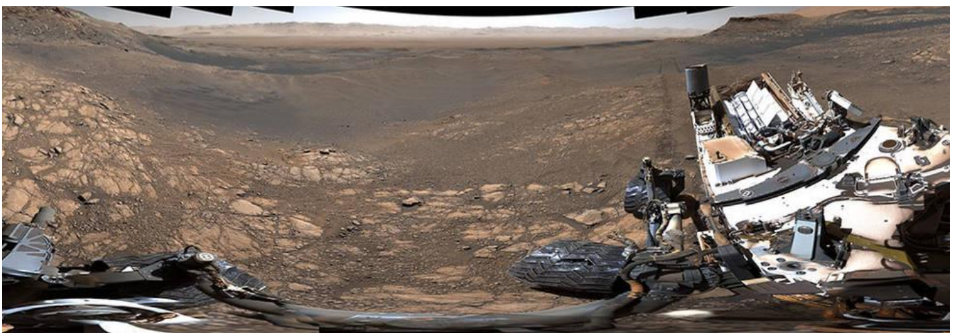
Le plus grand panorama réalisé par Curiosity

Depuis son atterrissage sur Mars le 6 août 2012, le rover Curiosity de la NASA explore le mont Sharp, haut de 5500 mètres, dans le cratère Gale. Le rover a grimpé plus de 612 mètres, atteignant des roches progressivement plus jeunes qui servent de record sur la façon dont Mars a évolué d'une planète humide et habitable à un environnement désertique froid.